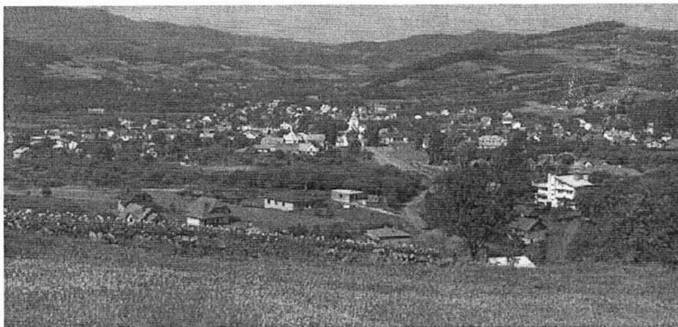
Przepiękna panorama na gminę Łącko zachęca do zwiedzenia tego pięknego zakątka południowej Polski

Gmina Łącko znajduje się na terenie powiatu sądeckiego w województwie małopolskim, na krawędzi Beskidu Wyspowego i Beskidu Sądeckiego nad zlewem rzek Dunajec i Czarna Woda na wys. 350-400 m n.p.m. Należy do najbardziej malowniczych miejsc na Sądecczyźnie, które przyciąga swoim niepowtarzalnym urokiem. Zajmuje 132 km kw., a na terenie 16 wiosek mieszka blisko 15 tys. osób.