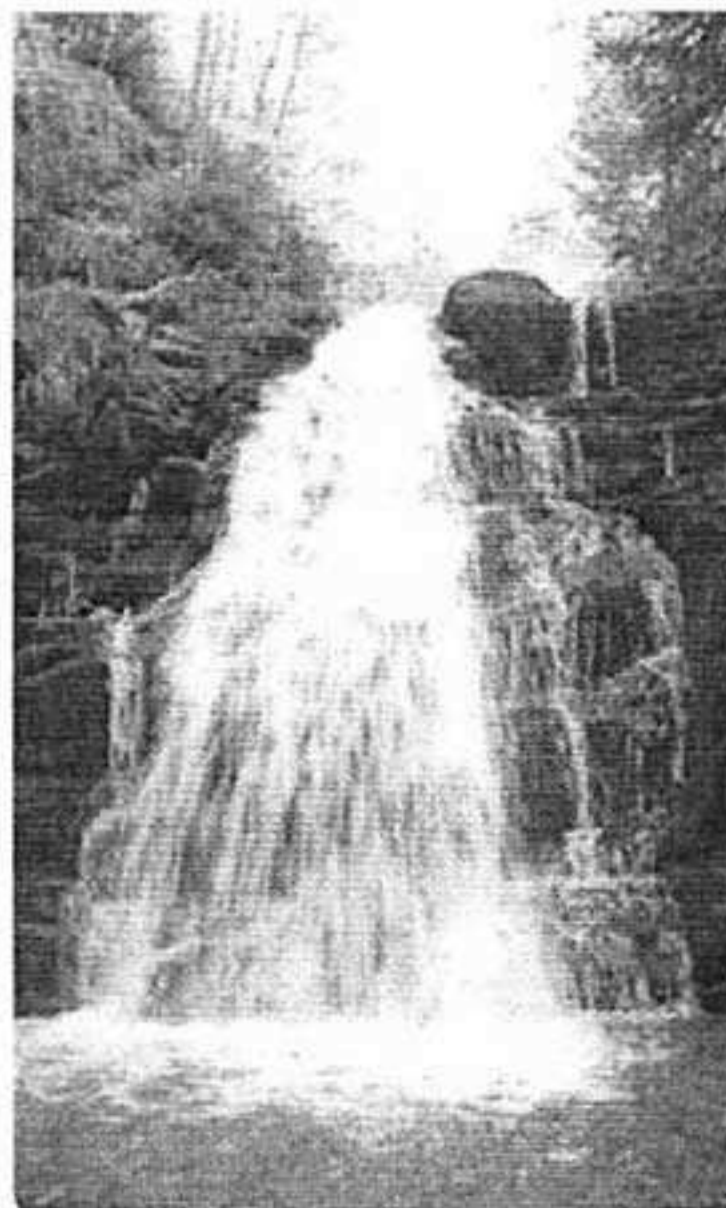
W gminie wiele jest także bardzo urokliwych wodospadów