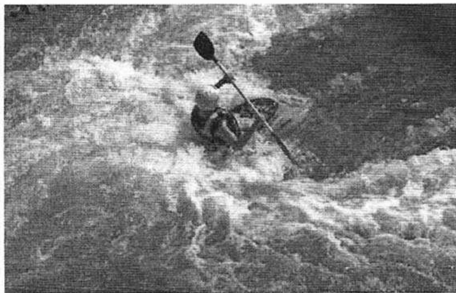
Sztuczny tor kajakowy umożliwia organizowanie międzynarodowych zawodów w kajakarstwie górskim najwyższej rangi takich jak Mistrzostwa Europy czy Mistrzostwa Świata.

Na uwagę zasługuje także zabytkowa drewniana architektura wsi. Jadąc samochodem zauważymy, że wzdłuż szosy stoją liczne krzyże przydrożne i kapliczki. Niedaleko ośrodka zdrowia rośnie kolejny pomnik przyrody – wiekowy i bardzo rozłożysty dąb „Paweł”.