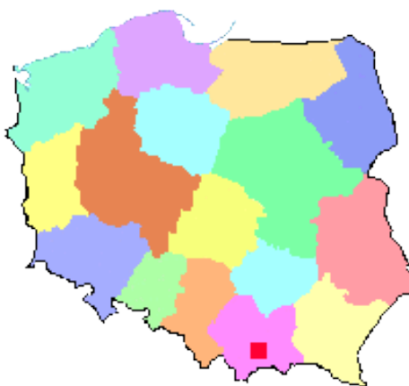
Mapa 1. Położenie Gminy Łącko w Polsce

Źródło: http://www.regiozet.pl/gazeta.php?choice=1002 , data edycji 15.12.2015