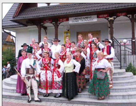
7.07. – Wybory „Nośwarnijysj Górolecki”