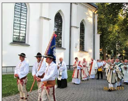
6.08. – Sanktuarium Maryjne – Ludźmierz