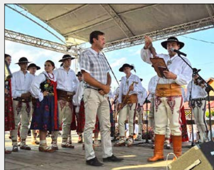
18.08. – Corno-biołe Biesiaduwanie

Zdjęcia: Krzysztof Adamczyk, Dawid Lis, Tomasz Ćwikowski, Grzegorz Czepelak, Ewa Gałysa, Łukasz Wolański, Szczepan Ćwikowski, s. Danuta.