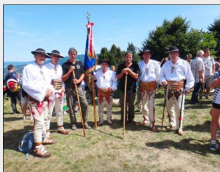
4.08. – Redyk Karpacki – Msza św. na Błyszczu