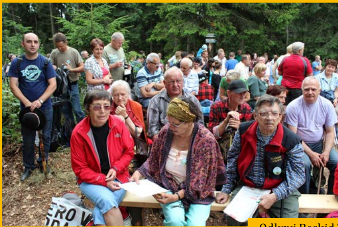
Odkryj Beskid Wyspowy – Modyń