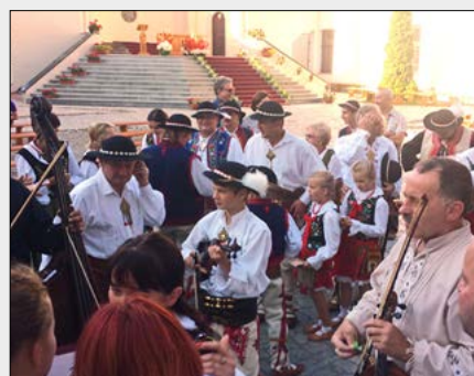
24.07. – Odpust św. Kingi w Starym Sączu