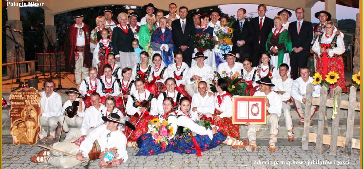
Zdjęcie pamiątkowe jubilatów i gości