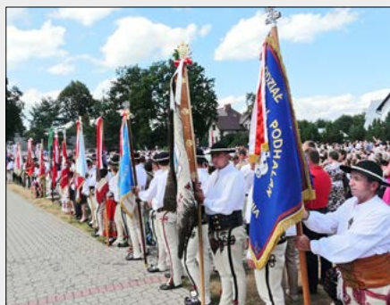
15.08. – 50-lecie koronacji Matki Bożej – Ludźmierz