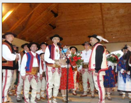
20.07. – Jubileusz „Górali Łąckich”