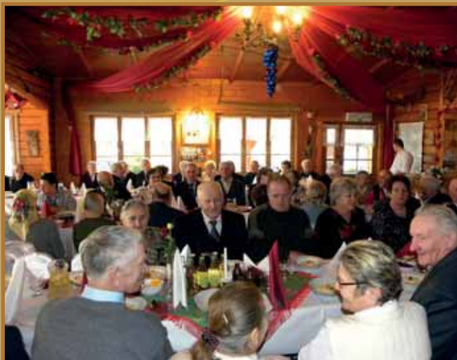
Złote Gody par małżeńskich z Gminy Łącko