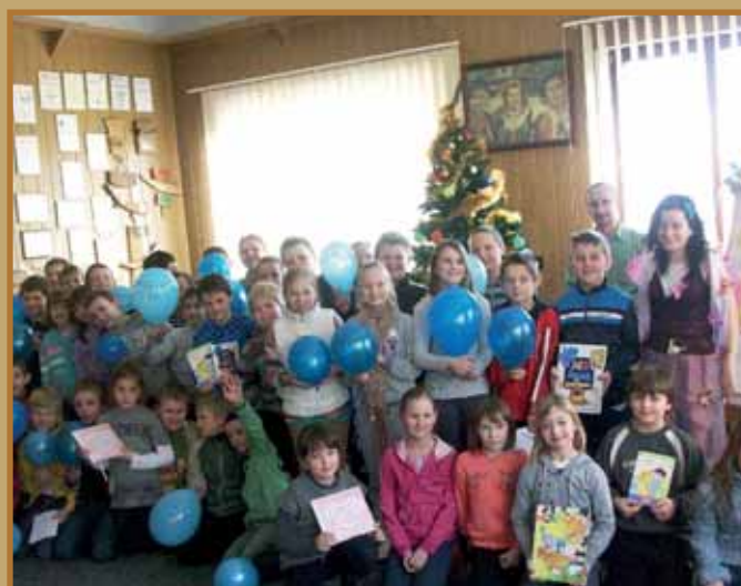
Spotkanie autorskie z Babcią Grunią