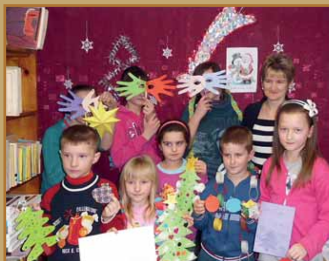
Spotkanie czytelnicze w Filii GBP w Woli Kosnowe