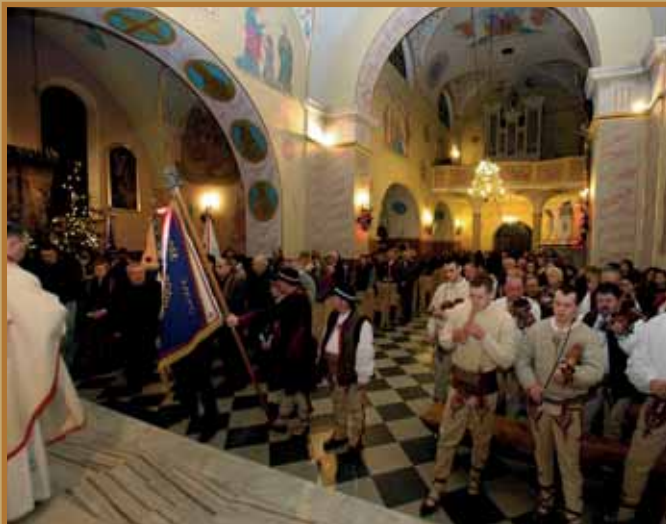
Msza św. rozpoczynająca Opatkę Związku Podhalań