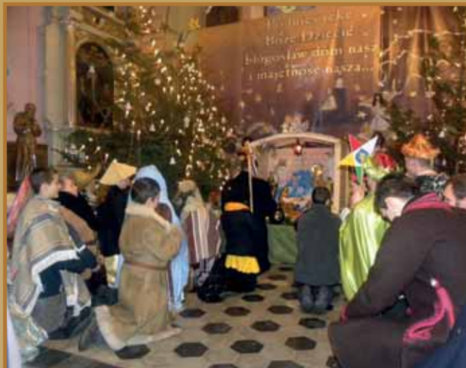
Pochód Trzech Króli i Koncert Kolęd w Łącku