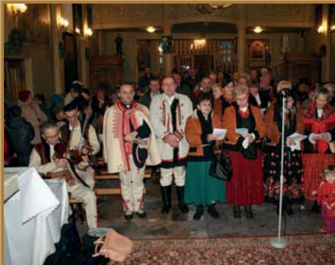
Związek Podhalań z wizytą u swojego kapelana