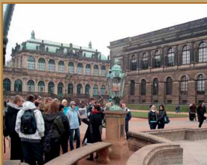
Młodzież z Zespołu Szkół im. Św. Kingi na praktykach w Niemczech