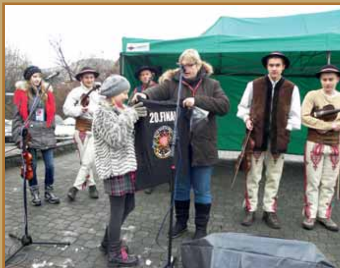
XX Finał WOŚP w Łącku