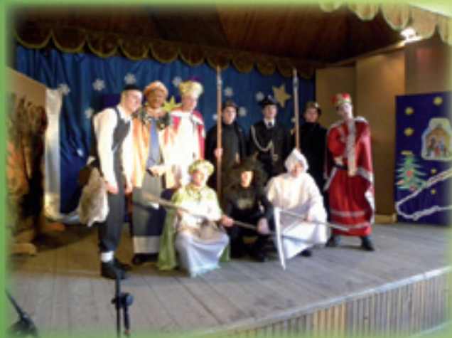
... i „Herody” z Górali Łąckich