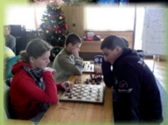
Ferie 2011 z GOK-iem