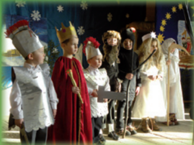
Przedszkola w Jazowsku....