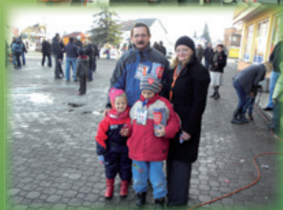
XIX Finał Wielkiej Orkiestry Świątecznej Pomocy w Łącku