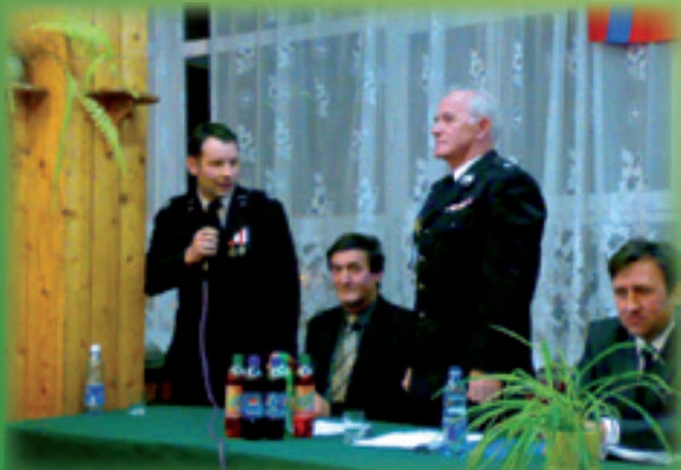
Walne Zebranie OSP w Łącku