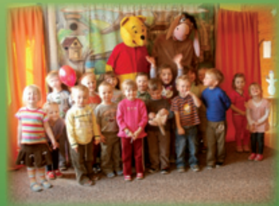
Rok działalności „Promyczka”