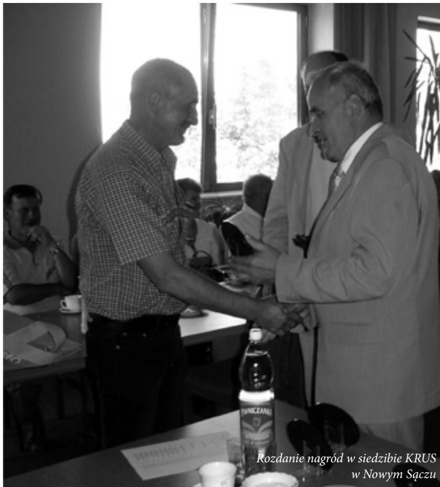
Rozdanie nagród w siedzibie KRUS w Nowym Sączu

Kasa Rolniczego Ubezpieczenia Społecznego od 2003 roku prowadzi we współpracy z Ministerstwem Rolnictwa i Rozwoju Wsi, Agencją Nieruchomości Rolnych oraz Państwową Inspekcją Pracy, ogólnokrajowy konkurs: „ Bezpieczne Gospodarstwo Rolne ”. O skuteczności popularyzacji w tej sposób „Zasad ochrony zdrowia i życia w gospodarstwie rolnym” świadczy liczba uczestników konkursu. W kategorii gospo-