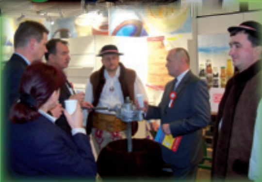
Targi w Berlinie – stoisko odwiedził Minister Rolnictwa Marek Sawicki