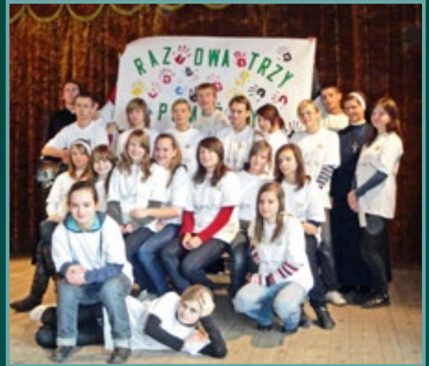
Szkolne Koło Caritas z Łącka