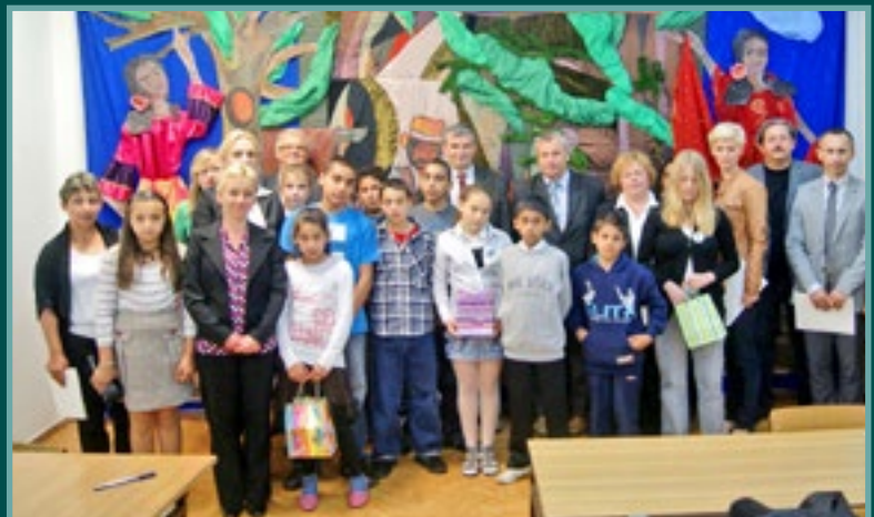
Uczestnicy I Międzyszkolnej Olimpiady Polsko-Romskiej w SP w Maszkowicach