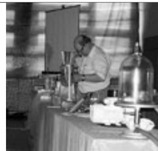
Pracownicy uniwersytetu z gościnną wizytą w naszym Gimnazjum