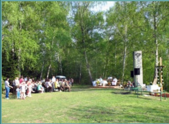
Msza Św. na Górze Zyndrama