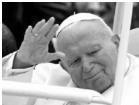
Sługa Boży Jan Paweł II