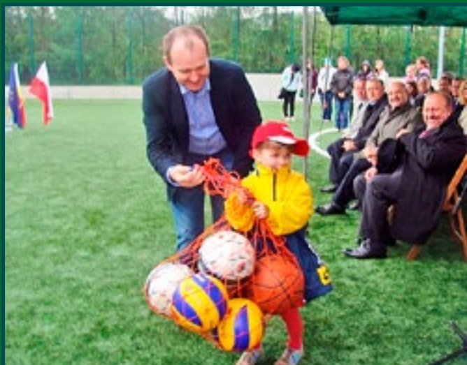
Otwarcie kompleksu sportowego Orlik 2012 w Łącku