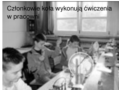
Członkowie koła wykonują ćwiczenia w pracowni