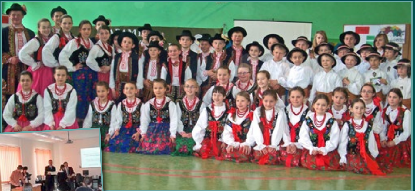
Górale i Lachy – projekt ZSG w Łącku