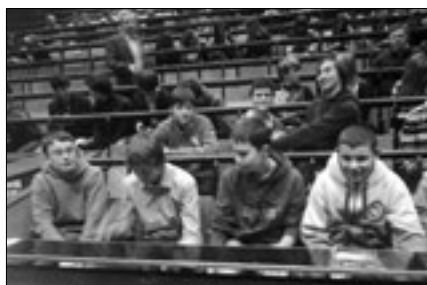
Uczniowie podczas wykładów na Uniwersytecie Jagiellońskim

W dniu 5 marca 2009 roku odbyło się inauguracyjne spotkanie