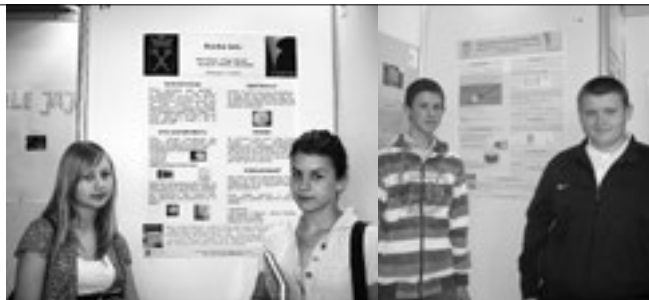
Uczniowie i ich plakaty w ramach pokazu prac na Uniwersytecie Jagiellońskim