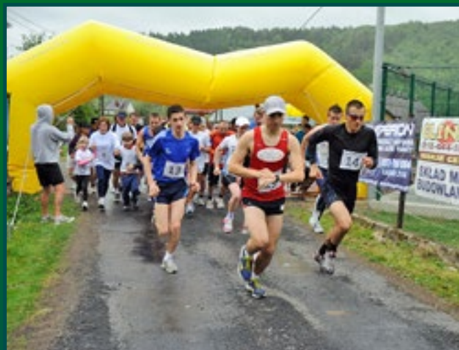
I Bieg Górski Kwitnącej Jabłoni