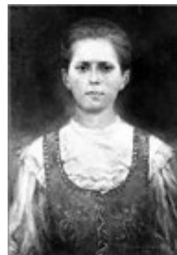
Bł. Karolina Kózka Patronka Szkolnych Kół „Caritas”