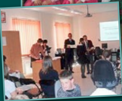
XII Gminny Konkurs Ortograficzny w ZSP w Kadczy