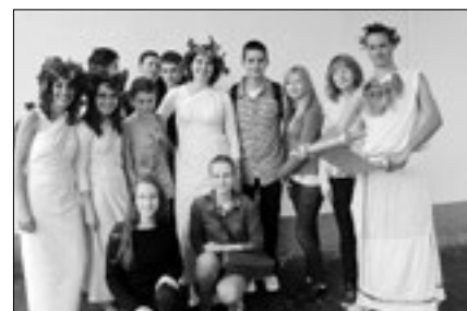
Uczniowie zawierają znajomości ze studentami UJ