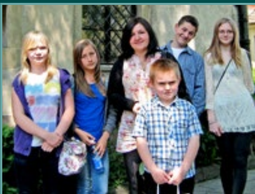
Moja przygoda w Muzeum – delegacja uczestników projektu POKL „W świecie sztuki” na wystawie