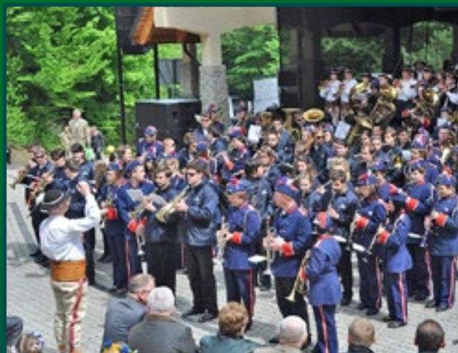
Festiwal Orkiestr Dętych i Zespołów Muzycznych „Złote Trąby”