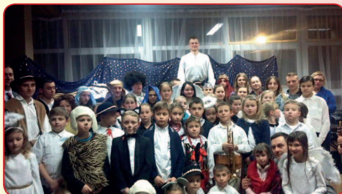
Podsumowanie półroczia w Ognisku Muzycznym i Grupie Teatralnej „Berecik”