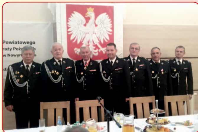
Delegaci gminnego oddziału OSP na IV Powiatowym Zjeździe