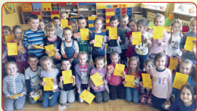
Dzień Pluszowego Misia w bibliotece w Woli Koszowej