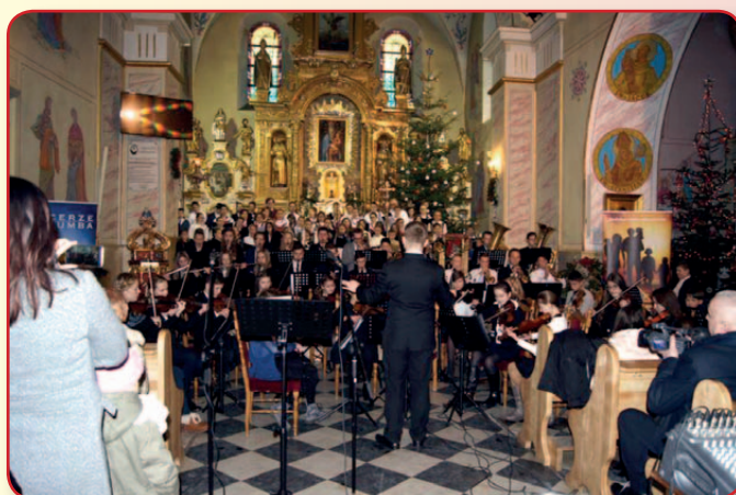
... i w Łącku