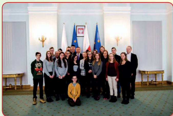
Młodzież z Łącka u Prezydenta RP Andrzeja Dudy