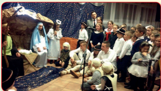
Podsumowanie półroczia w Ognisku Muzycznym i Grupie Teatralnej „Berecik”