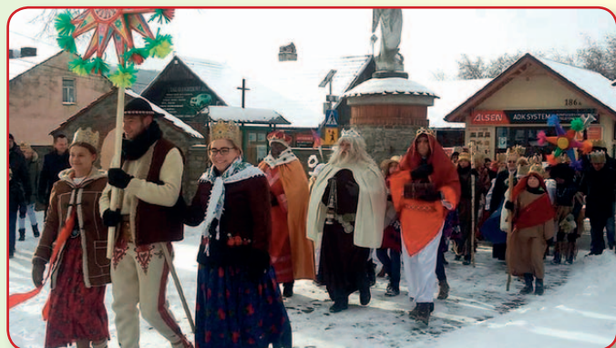
Orszak Trzech Króli