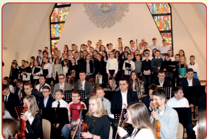
Koncert Noworoczny w Woli Koszowej...