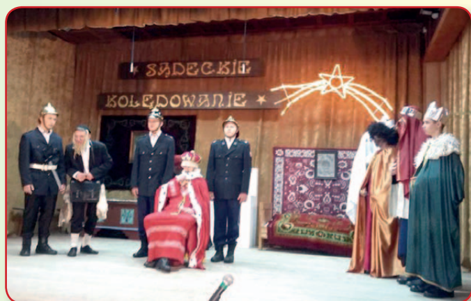
Herody z Łącka na Sądeckim Kolędowaniu