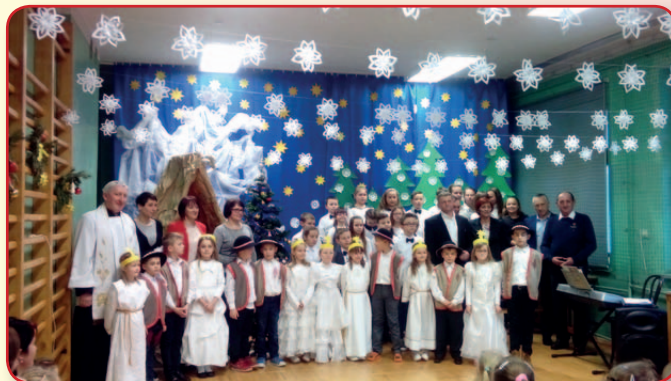
Spotkanie Noworoczne w SP w Kiczni