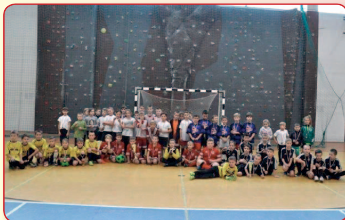
Świąteczny Turniej Piłki Halowej dla uczniów kl. I-III