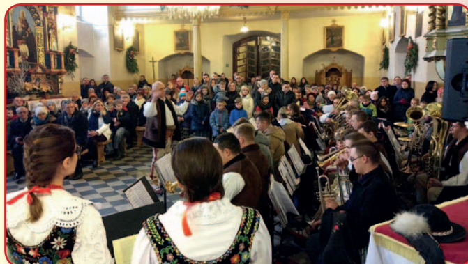
Kolędowanie w Jazowsku