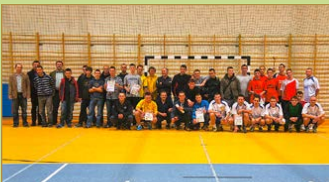
Turniej Charytatywny „Gramy dla Damiana”