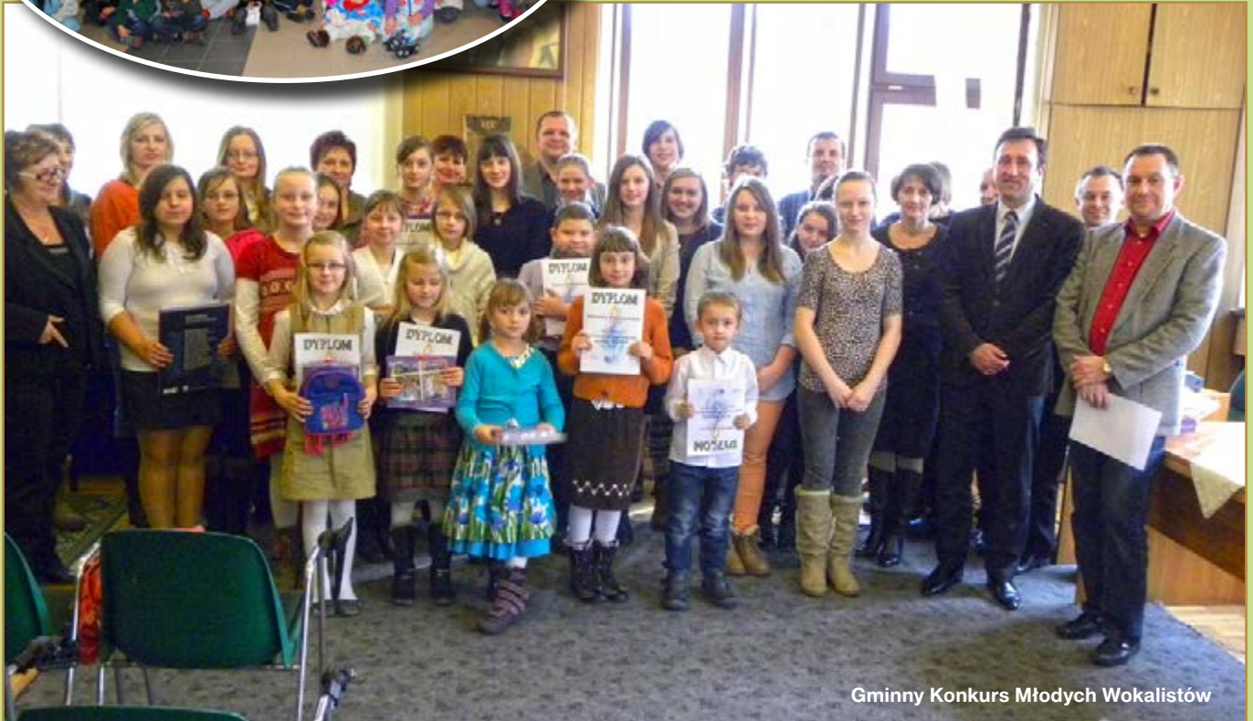
Gminny Konkurs Młodych Wokalistów