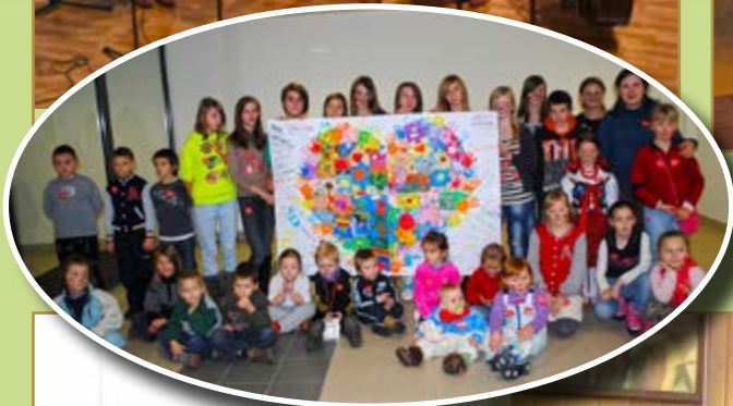
Finiał WOŚP w Łącku