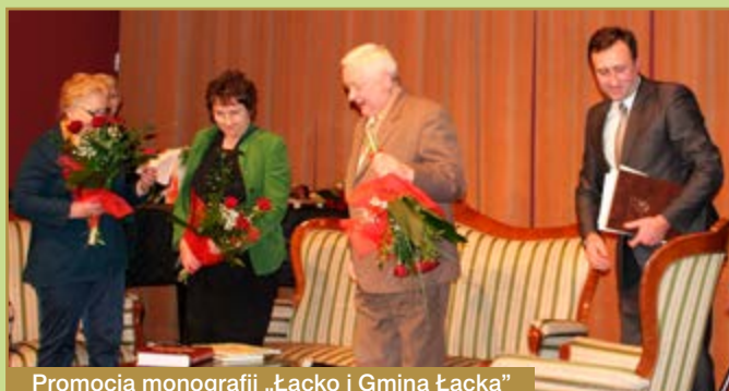
Promocja monografii „Łącko i Gmina Łącka”