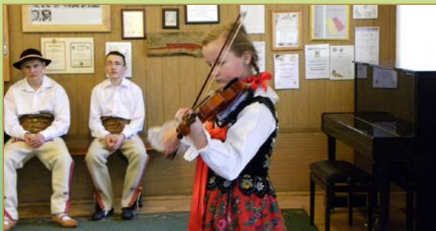
Gminny Konkurs Poezji Regionalnej i Gadek Ludowych